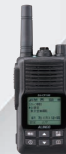
DJ-CP100 IPトランシーバー(音源用)