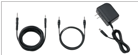
左 ▶ ガイダンス送信ケーブル(3m : UX1694) 中央 ▶ オーディオケーブル(1m : UX1372) 右 ▶ ACアダプター (1.8m : EDC-286)