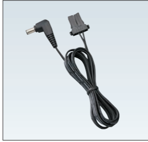
EDS-42 DJ-DPS70用電源ケーブル (ケーブル長2.0m)