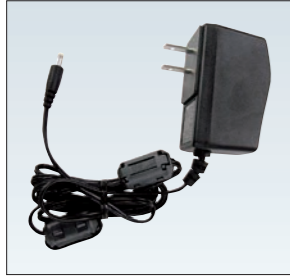
EDC-122 DJ-P240L用ACアダプター (ケーブル長1.8m) 親機の外部電源端子に接続するACアダプターです。