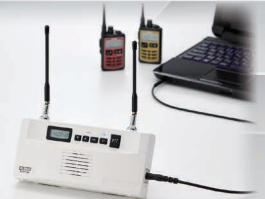
DJ-P115R (特定小電力無線中継器の構成例)