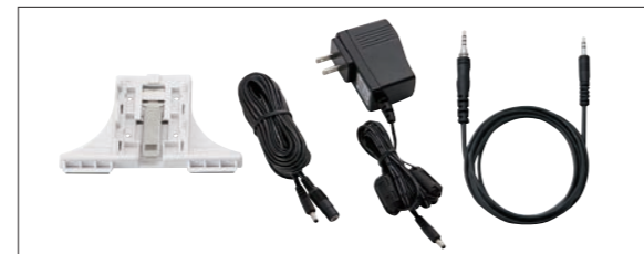
左 ▶ 壁掛け/卓上兼用スタンド 中央 ▶ 電源延長ケーブル (5m : UX1376)とACアダプター EDC-122 右 ▶ 音源接続用ケーブル (3m : UX1694)