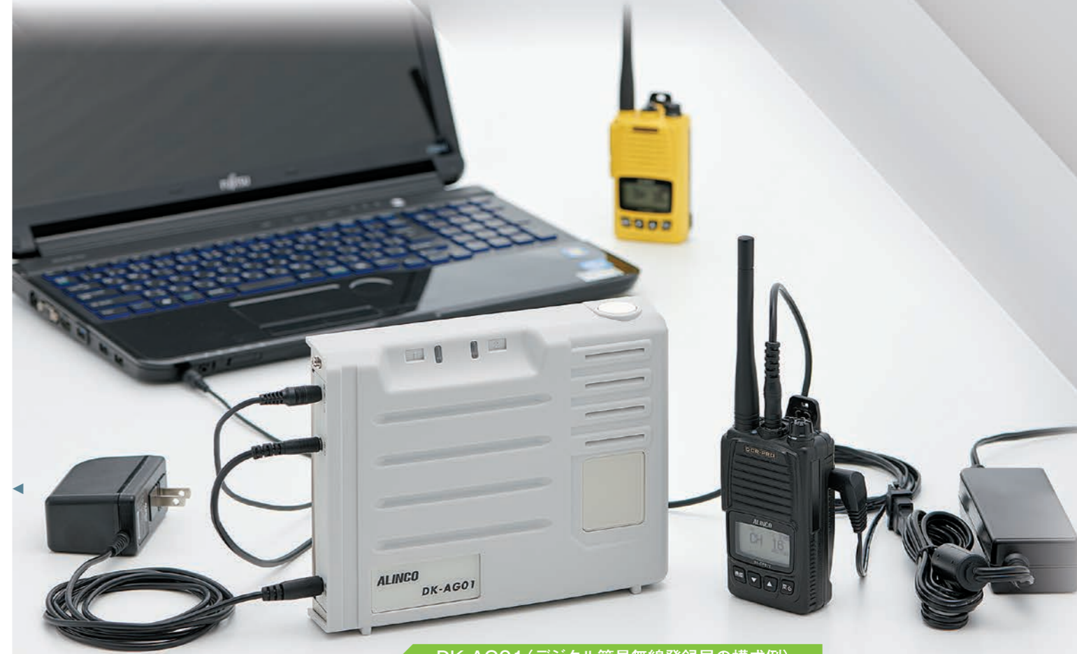
DK-AG01 (デジタル簡易無線登録局の構成例)