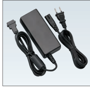
EDC-702 DJ-DPS70用ACアダプター (ケーブル長3.2m) 専用のACアダプターと電源ケーブルで、バッテリーパックの代わりに装着したEDH-43を介して親機に電源を供給します。(IPトランシーバーにはガイダンス送信ケーブル接続用に別途EDS-14が必要です。)