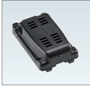
EDH-43 DJ-DPS70用 外部電源アダプター